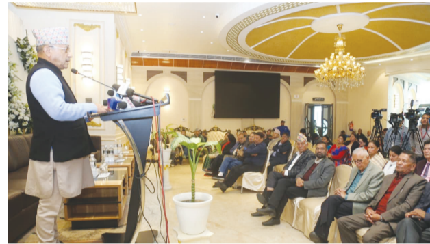
नेपाली कांग्रेसको देउवा-कोइराला समूहले आइतबार आयोजना गरेको बधाई तथा शुभकामना कार्यक्रममा सहभागीहरू।