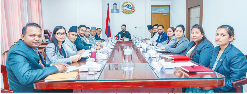
सिंहदरवारस्थित प्रधानमन्त्री तथा मन्त्रिपरिषद्को कार्यालयमा सोमबार बसेको मन्त्रिपरिषद्को बैठक।

संविधान संशोधन बहसपत्र तयार गर्न कार्यदल गठन